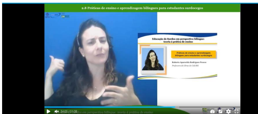
Módulo 2 - 2.8 Práticas de ensino e aprendizagem bilíngues para estudantes surdocegos