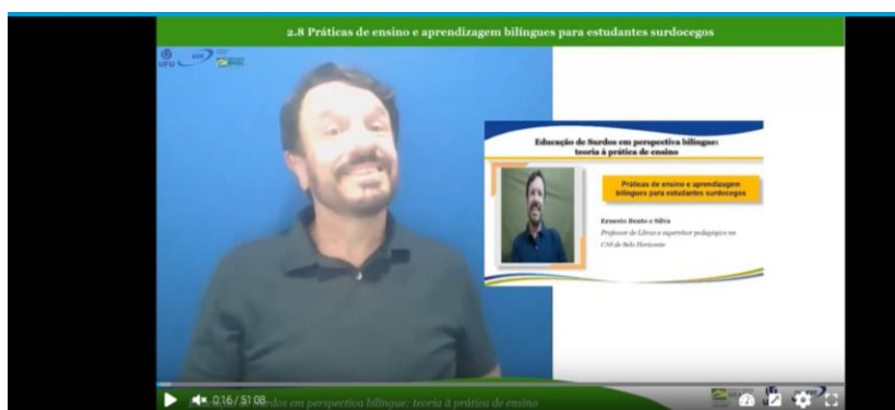
Módulo 2 - 2.8 Práticas de ensino e aprendizagem bilíngues para estudantes surdocegos